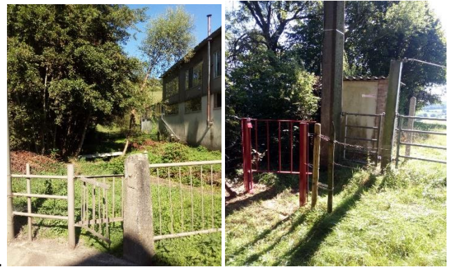
Point C sur la carte(menuiserie),échaliers ,ponceau(3 ème photo)

carte. Une autre réalisation analogue a été concrétisée simultanément entre la Menuiserie Hertay à Marquishof (Gulpen) et le réservoir de la Hees (de C vers D sur la carte) avec également un nouveau ponceau sur la Gulpe, juste derrière l'échelier existant situé à la route. 20 m au-delà du ponceau un nouvel échelier permet d'emprunter le sentier 102 qui part en biais pour rejoindre sur la colline le sentier 100 et le moignon de chemin 29 qui existe le long de la haie aboutissant près du réservoir SWDE à la Hees.