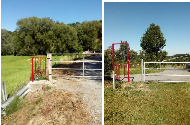
Les nouveaux échaliers au point A (près des étangs) (1 ère photo) et au point B (au carrefour du chemin de Kheer)(portique)(2 ème photo)

Ainsi depuis ce 22 juin le sentier 101 qui relie la rue Gulpen (à 500 m du carrefour de La Bach) à la Hees (croisement avec le chemin de Kheer) a été réhabilité par le placement d'échaliers. Le sentier a été préalablement déplacé par le conseil communal en utilisant désormais pour sa partie la plus proche de la Gulpen l'assiette du chemin privé débutant à côté des étangs et permettant un passage aisé de la Gulpe. Ensuite le tracé retrouve son tracé ancestral pour aboutir en face du chemin de Kheer. C'est le tracé A-B sur la