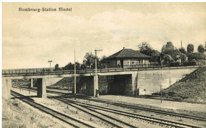
Vue de la gare de Hindel depuis le Bisweg. Derrière le pont de la L 38, on voit les piliers et culées du pont de la grand route. Le bâtiment est en bois.

Depuis le 1.4.1919 les trains de la ligne Visé-Montzen s'arrêtent à Hindel (qui s'appelait au début « Hombourg-Est ») C'est le 7 octobre 1919 que les trains de la ligne Plombières-Liège s'arrêtèrent pour la première fois à Hindel (par transfert de la halte du Cheval-Blanc à Hindel). Depuis Hombourg-Est est devenu « Hindel Haut » (L.38) et « Hindel-Bas » (L 24)