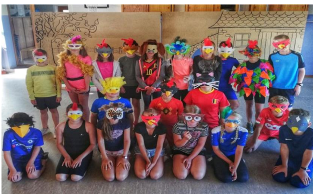
La classe de 5e et 6e primaire de l'école de Hombourg.

Décus de voir leur pièce fermée au public, les élèves de 5e et 6e primaire font preuve de créativité.