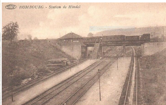
La gare de Hindel vue depuis la grand-route avec un train sur la L 38 et les escaliers entre Hindel Haut et Hindel-Bas. La gare est une sorte de chalet en bois. En bas (L 24) deux quais mais un seul vers les escaliers...

La gare à deux niveaux de Hindel a été en service de 1919 à 1952 mais a perdu son personnel dès 1946. Le bâtiment de la gare a été démoli avant 1953. La halte de Hindel-Bas a été supprimé avec le reste de la ligne 38 en 1958 (les trains venant d'Aubel empruntant de 1952 à 1958 la bifurcation via les « Trois-Ponts »). Les quais de Hindel Bas ont été supprimés en 1968.